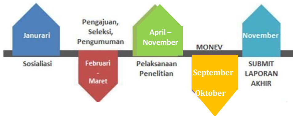
Gambar 2. 2. Jadwal pengajuan proposal pengabdian kepada masyarakat