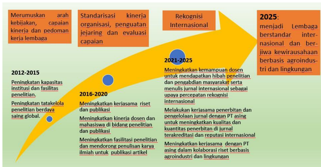
Gambar 6.1 Roadmap capaian LPPM UNJA

Selanjutnya berdasarkan arah transformasi dan reframing Penelitian dan Pengabdian Kepada Masyarakat Universitas Jambi, maka LPPM UNJA merumuskan arah pengembangan kelembagaan dan strategi guna mengakselerasi pencapaian visi universitas sebagai a world class entrepreneurship university berbasis agroindustri dan lingkungan.